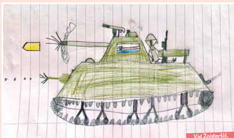
Vid Žnidaršič, 9 let

VPRAŠAJTE, ZAUPAJTE IN PIŠITE nam tudi vi na pogled@mladinska-knjiga.si